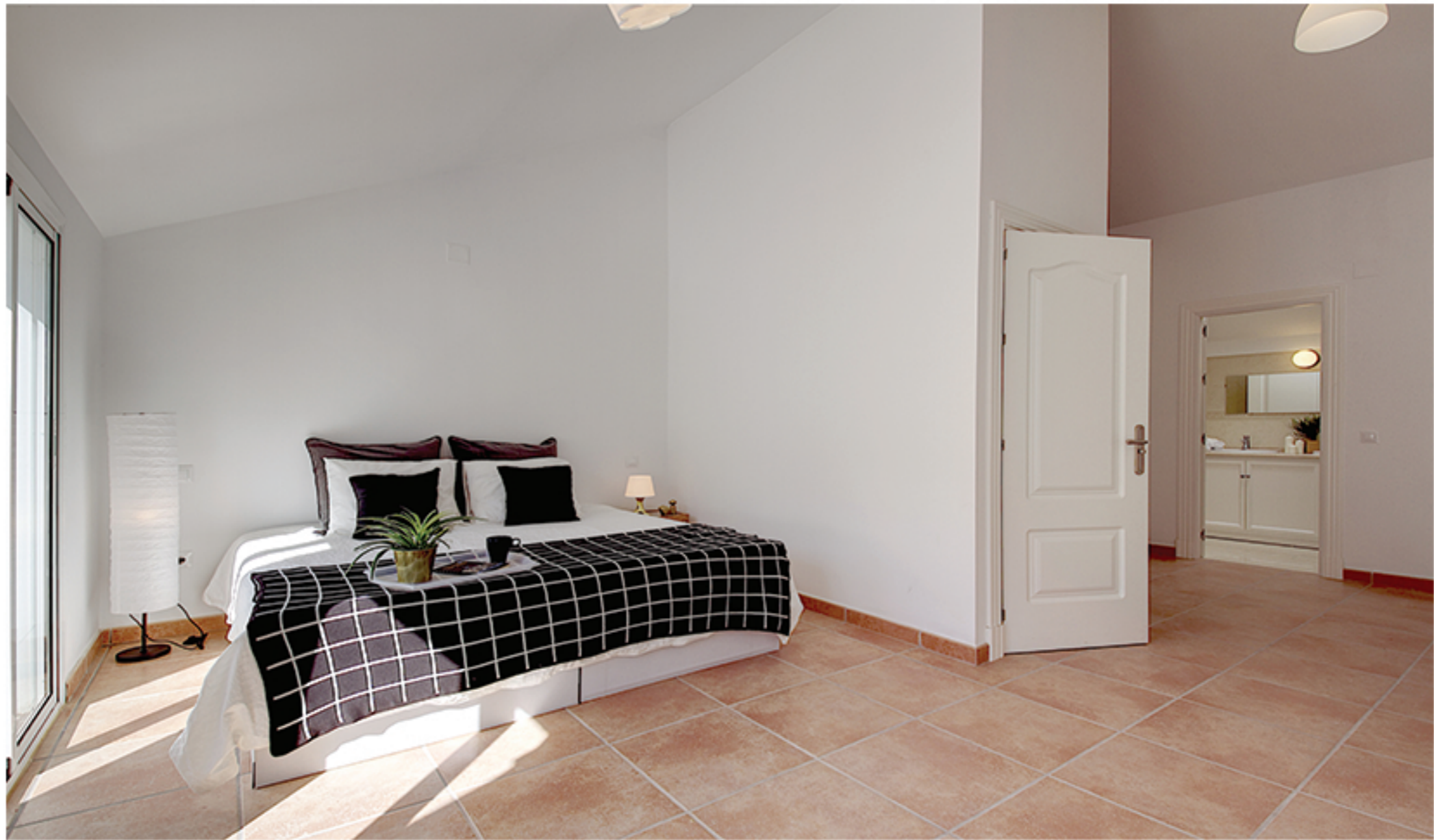
Dormitorio principal independiente con techos altos abuhardillados. Separate master bedroom with high ceilings.