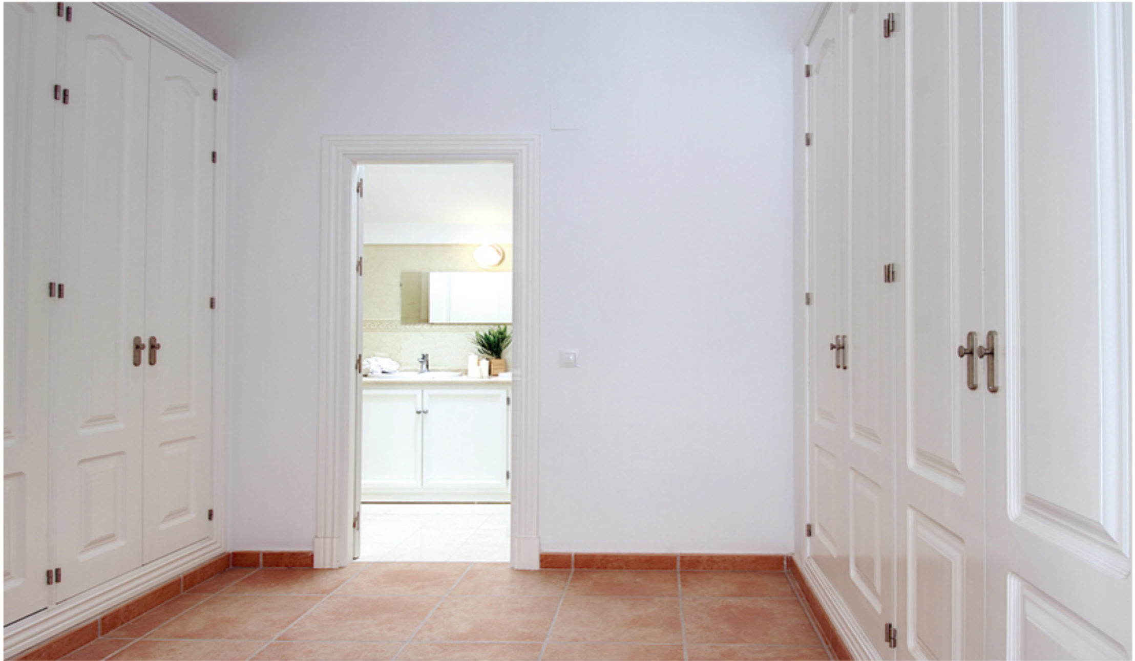
Amplio vestidor con armarios forrados de madera. Large dressing room with wood-lined wardrobes.