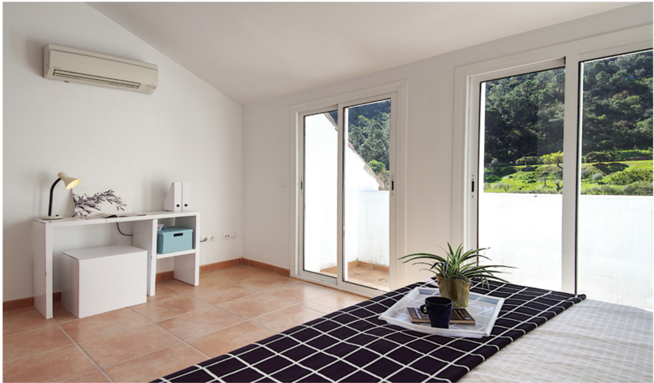
3 Amplios Dormitorios con Vestidor y Baño, Principal de 17m 2 mas terraza de 4 m 2 . 3 large bedrooms with dressing area and bathroom, master bedroom of 17m 2 plus terrace of 4 m 2 .